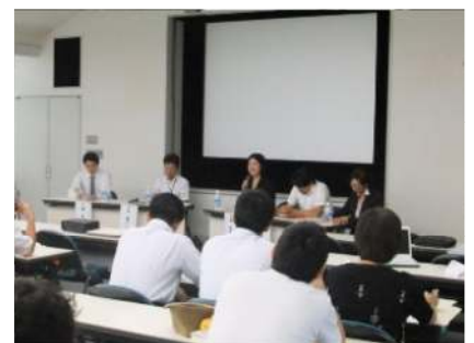
公開シンポジウム2010の様子